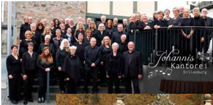
Eine besondere Mischung: Die Johanniskantorei Dillenburg und die Herborner Kantorei singen gemeinsam

An der Abendkasse kosten die Karten 22 € (ermäßigt 18 €). Einlass ab 16 Uhr, freie Platzwahl.